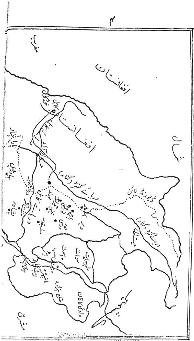
”محکم دلائل سے مزین متنوع و منفرد موضوعات پر مشتمل مفت آن لائن مکتبہ“