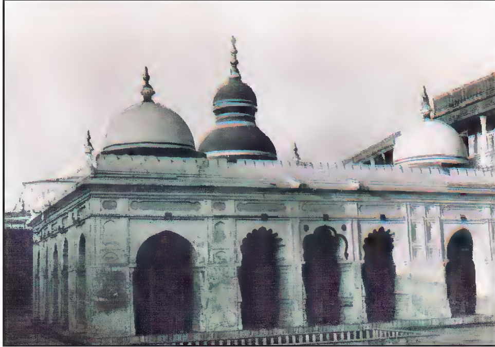
ایک اور منظر، مقبرہ حضرت شاہ پیر محمدؒ، پیر محمدؒ روڈ، احمد آباد