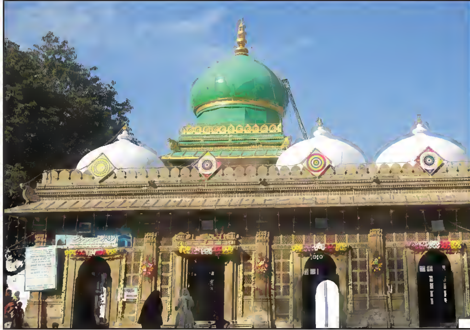
مقبرہ حضرت شاہ ولی الدین علویؒ، خان پور، لال دروازہ، احمد آباد