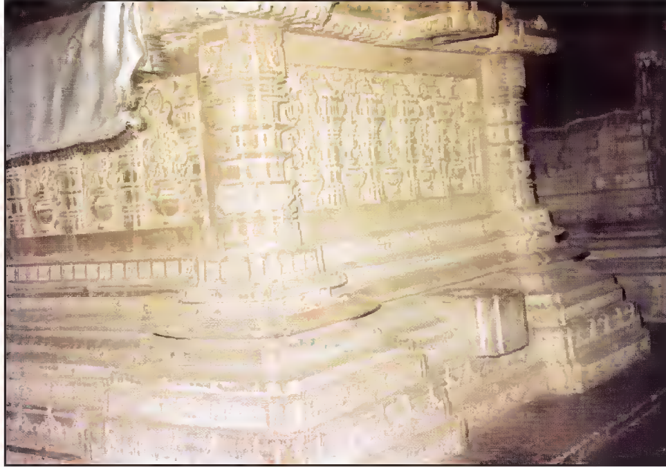
قبر محمود بیگدہ، سرخیز، احمد آباد