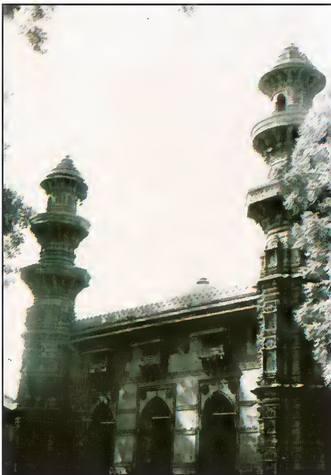
مسجد محافظ خان، احمد آباد