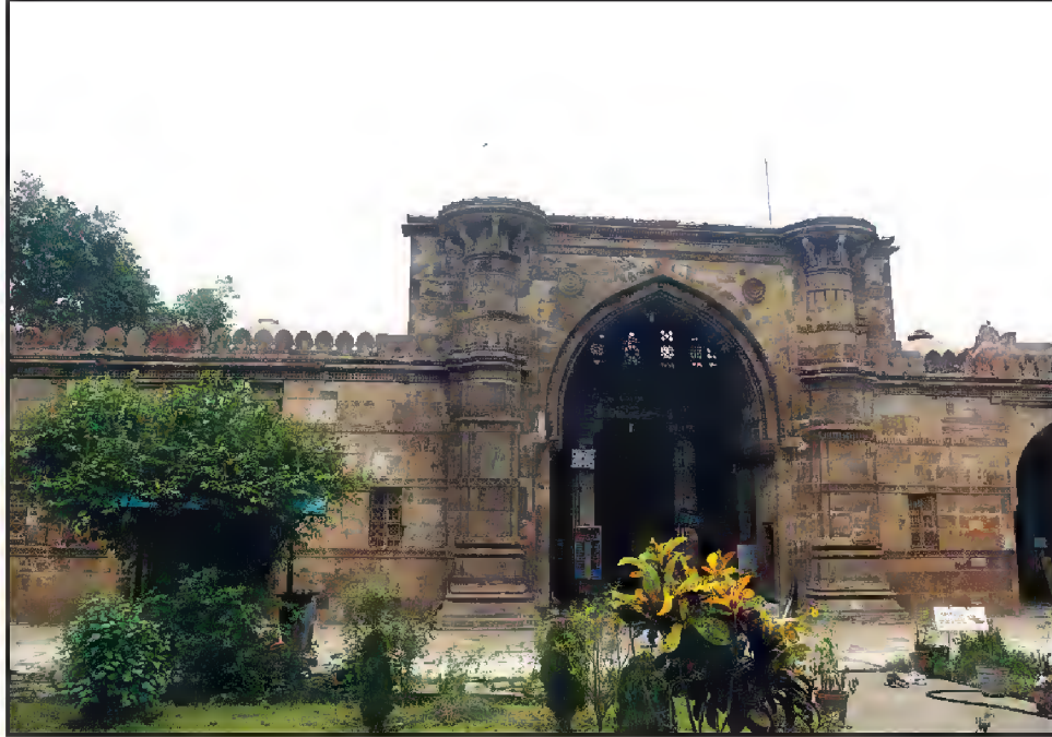
جامع مسجد قدیم، لال دروازہ، احمد آباد