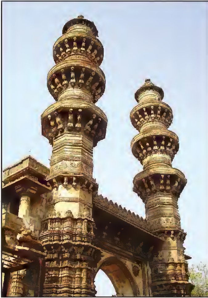
جھولتا منارہ، مسجد سیدی بشیر سارنگ پور، احمد آباد