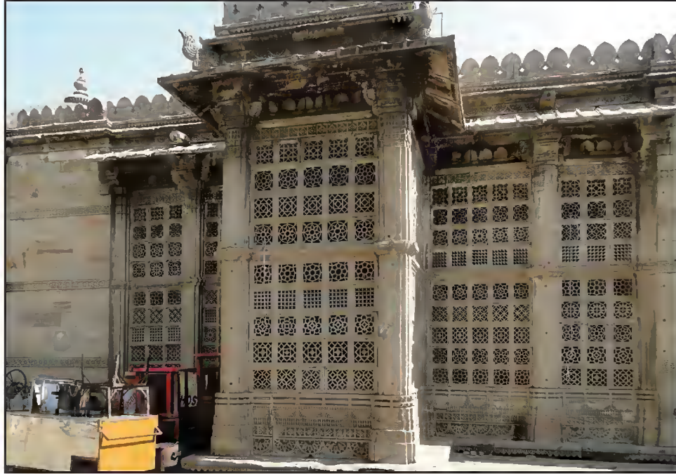
مقبره، سلطان احمد شاه اول، مانک چوک، احمد آباد