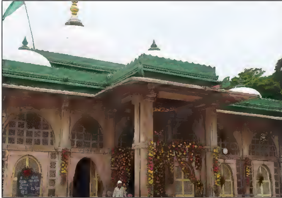
مزار مبارک حضرت شاہ عالمؒ، شاہ عالم روڈ، احمد آباد