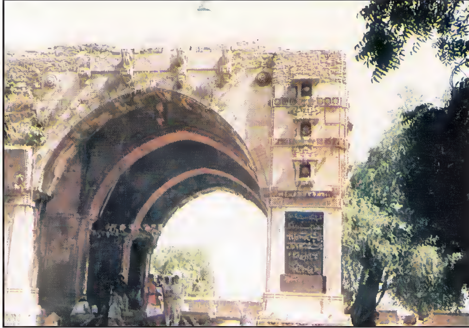
صدر دروازہ، مقبرہ حضرت قطب عالم، ٹٹوا، احمد آباد