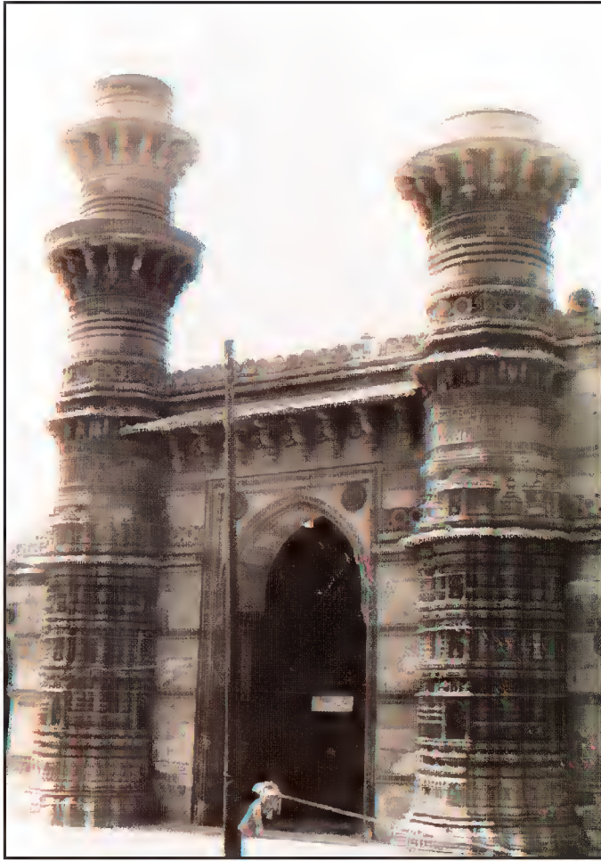
مسجد اچھوت کوئی، دودھیشور، احمد آباد