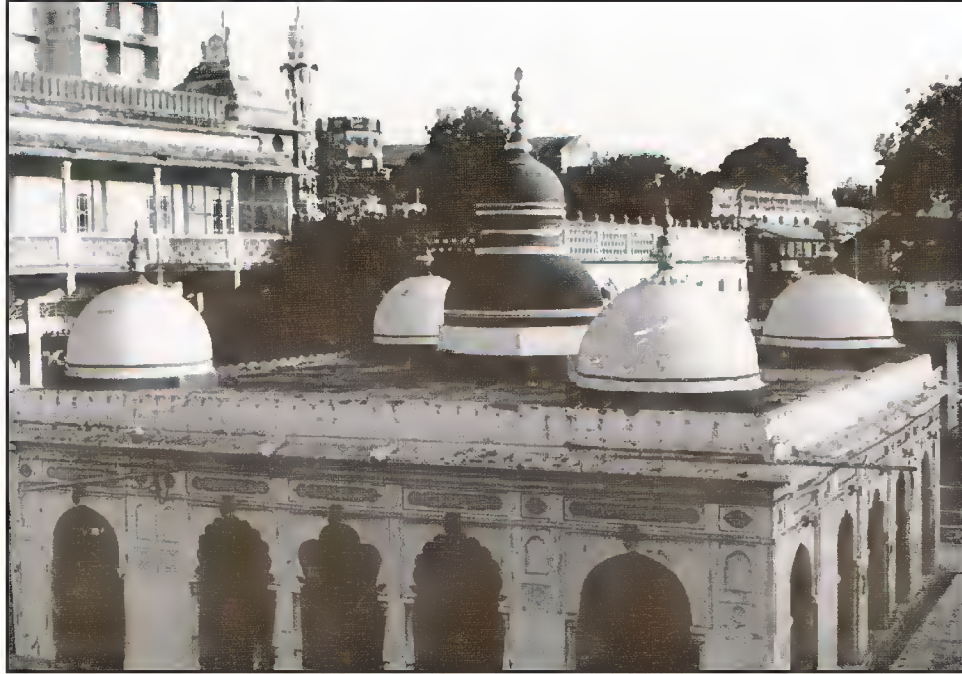
مقبرہ حضرت شاہ پیر محمدؒ، پیر محمد روڈ، احمد آباد