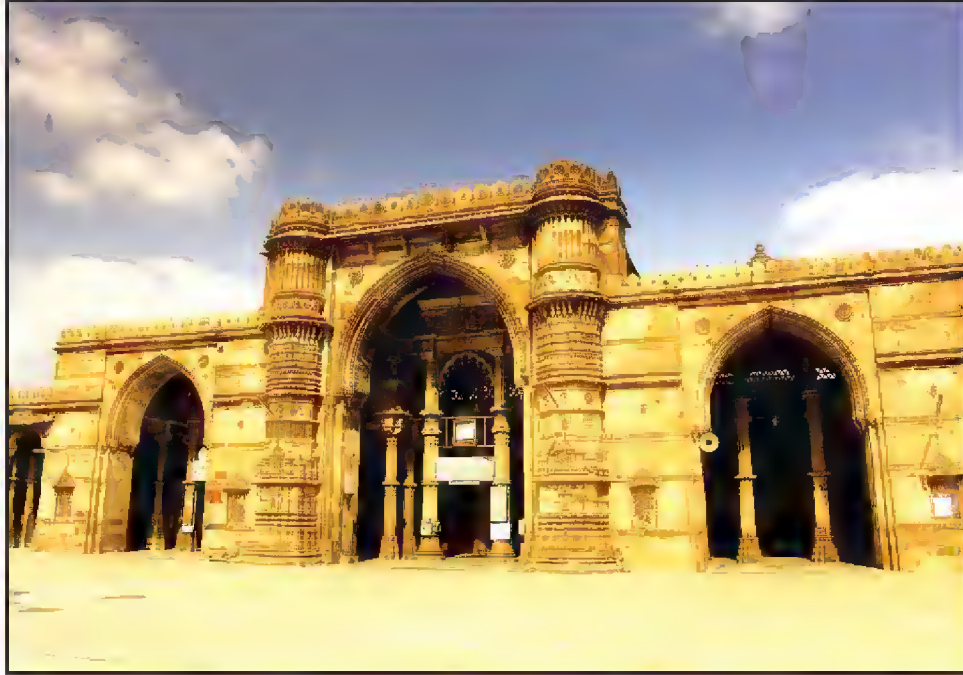
جامع مسجد جدید، سلطان احمد شاہ اول، مانک چوک، احمد آباد