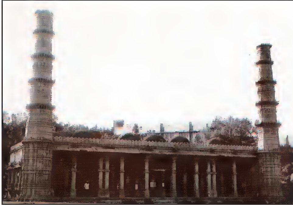
مسجد حضرت شمع برہانیؒ، عثمان پورہ، احمد آباد