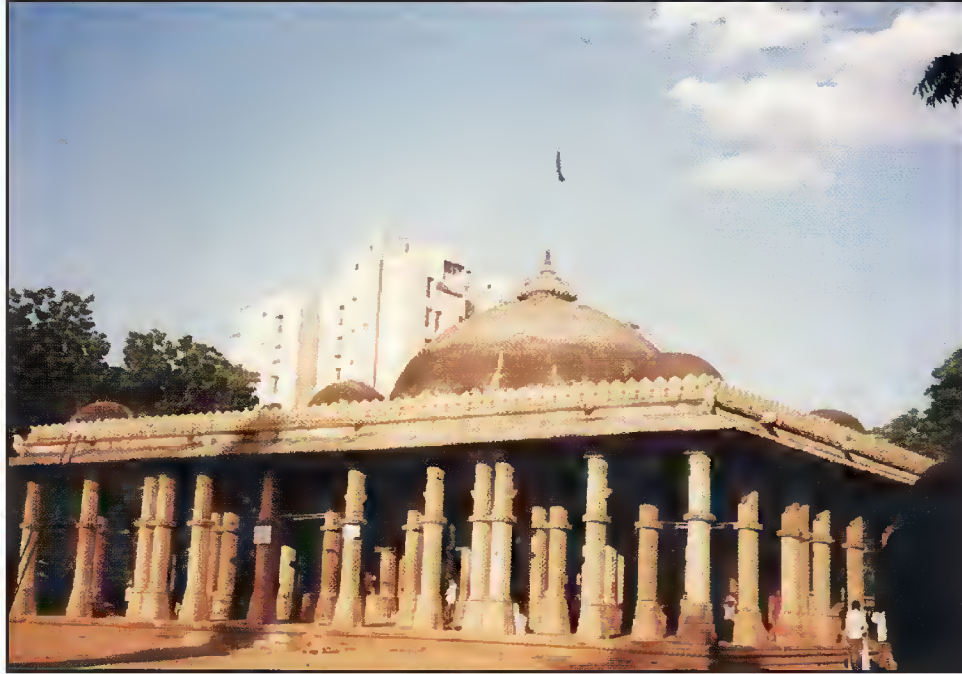
مقبرہ حضرت شمع برہانیؒ، عثمان پورہ، احمد آباد