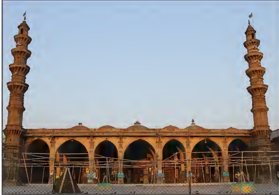
مسجد حضرت شاه عالمؒ، شاه عالم روڈ، احمد آباد