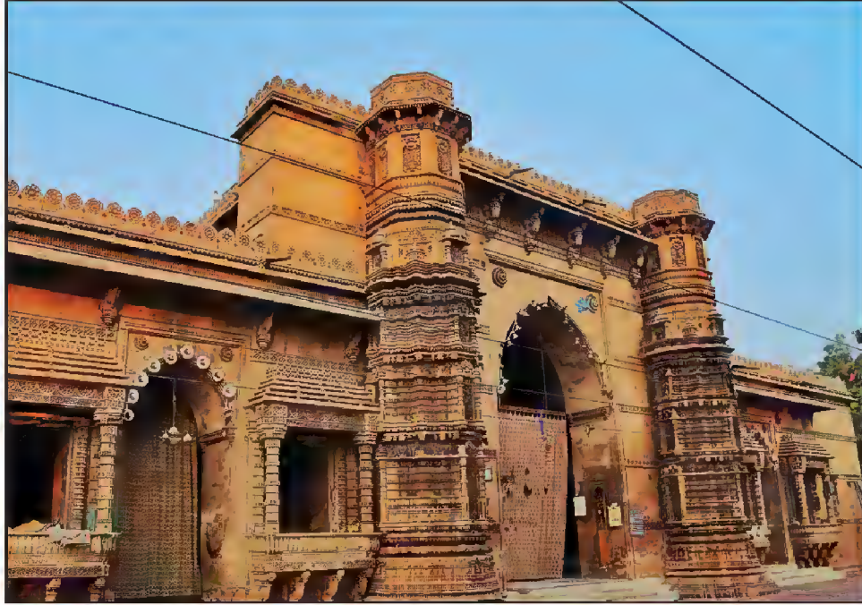
مسجد رانی روپ متی، مرزا پور، احمد آباد