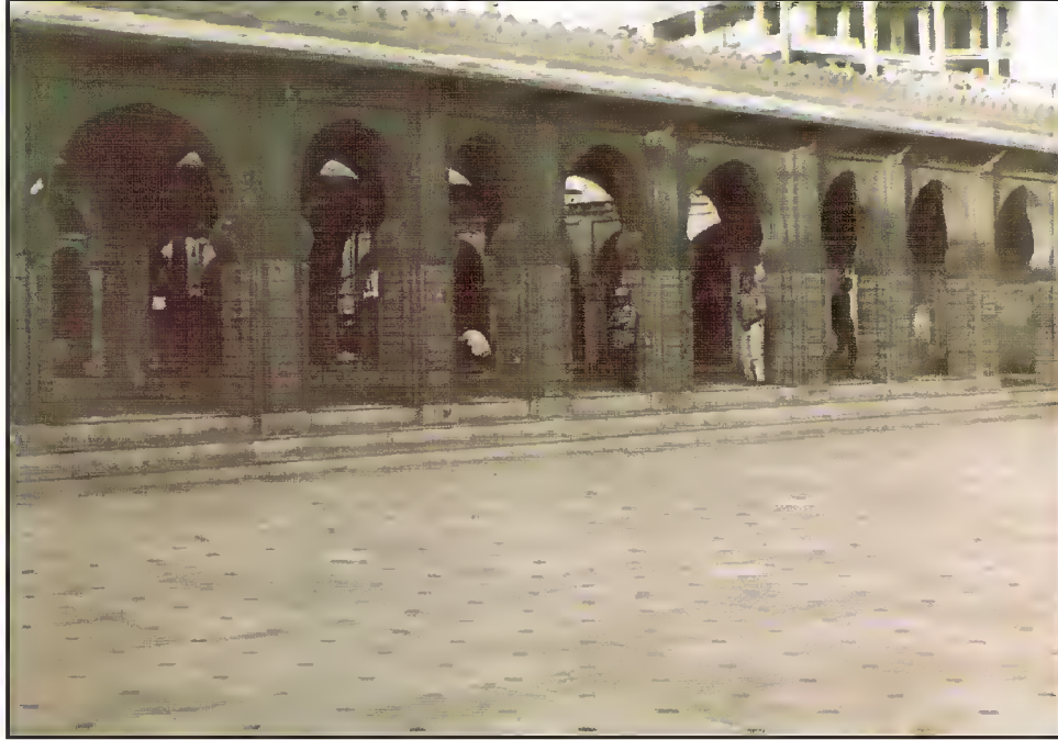
مسجد حضرت شاہ پیر محمدؒ، پیر محمد روڈ، احمد آباد