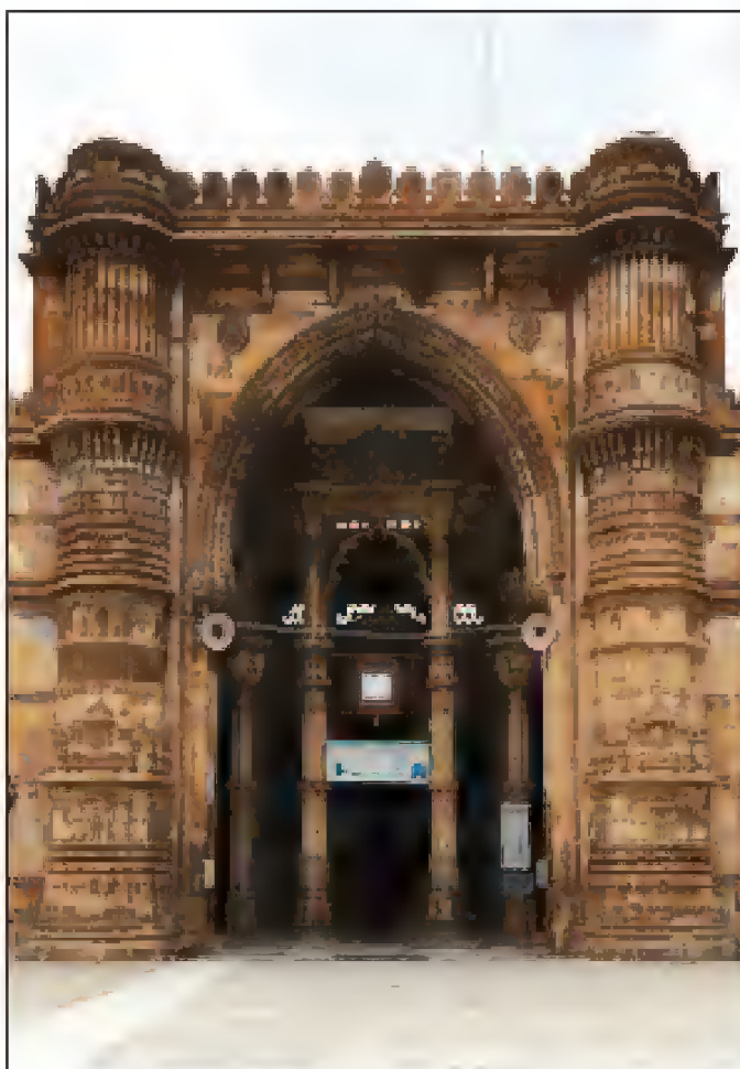
جامع مسجد سلطانی اور شاہ اولیٰ باگ، لاہور، پاکستان