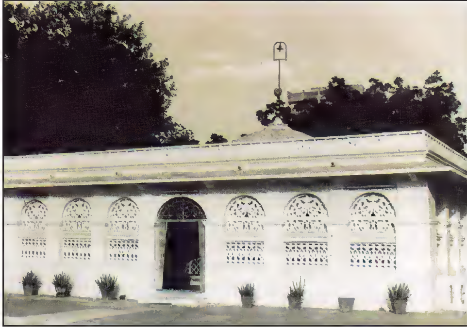
مزار حضرت جین شاہ، نورنگ پورہ، آشرم روڈ، احمد آباد