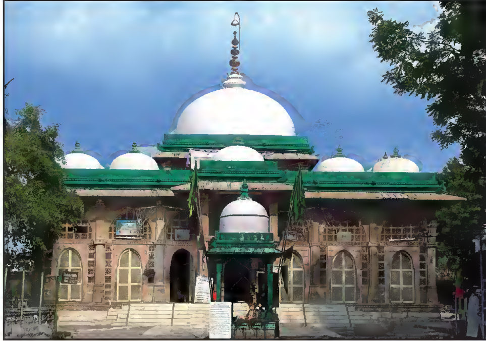
مقبرہ حضرت شاہ عالمؒ، شاہ عالم روڈ، احمد آباد