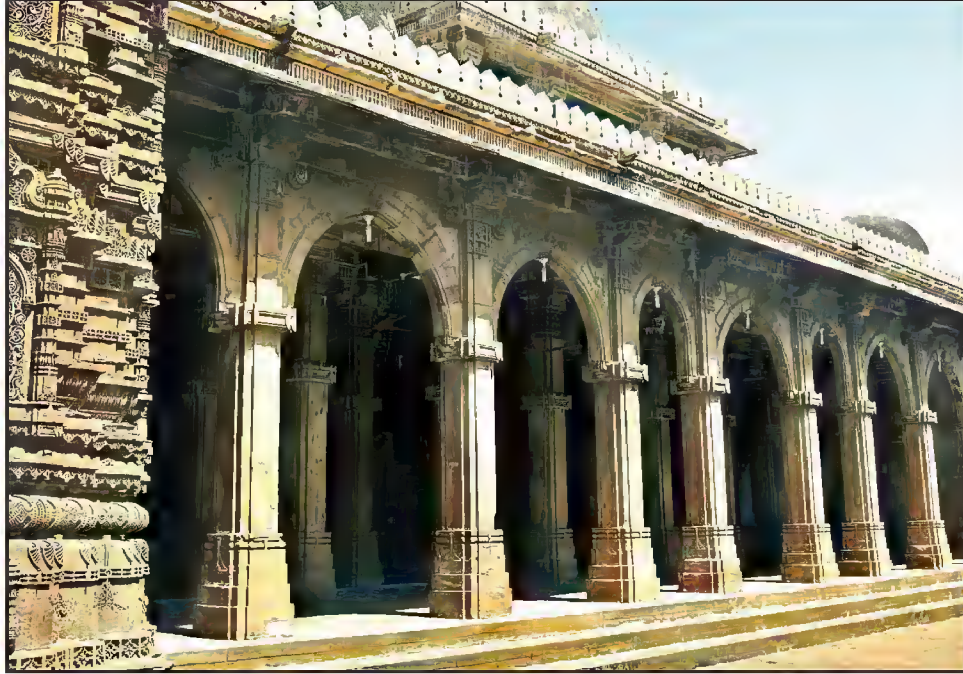
بیرونی منظر، مسجد حضرت ابو محمد بخاریؒ، عرف بابا لؤلؤی، منجوری، احمد آباد