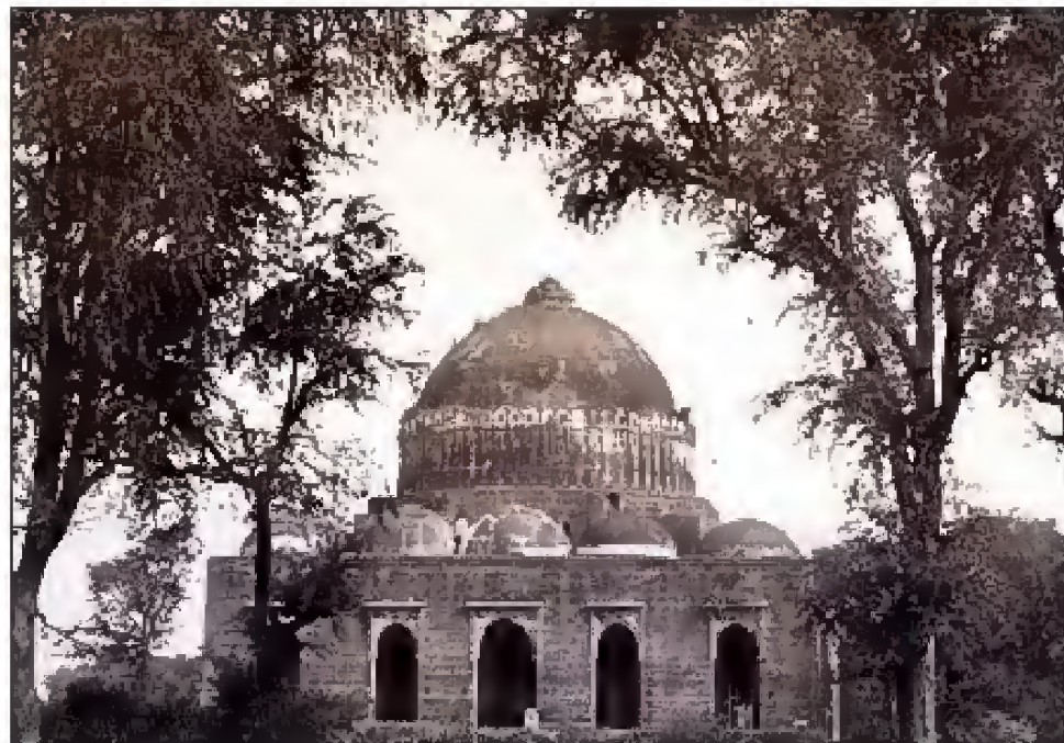
مشهور گنبد مقبره درخان، مشایکھا باغ، امرآباد