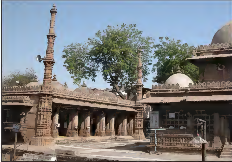
مسجد رانی سپری (صبری) استور یادروازه، احمدآباد