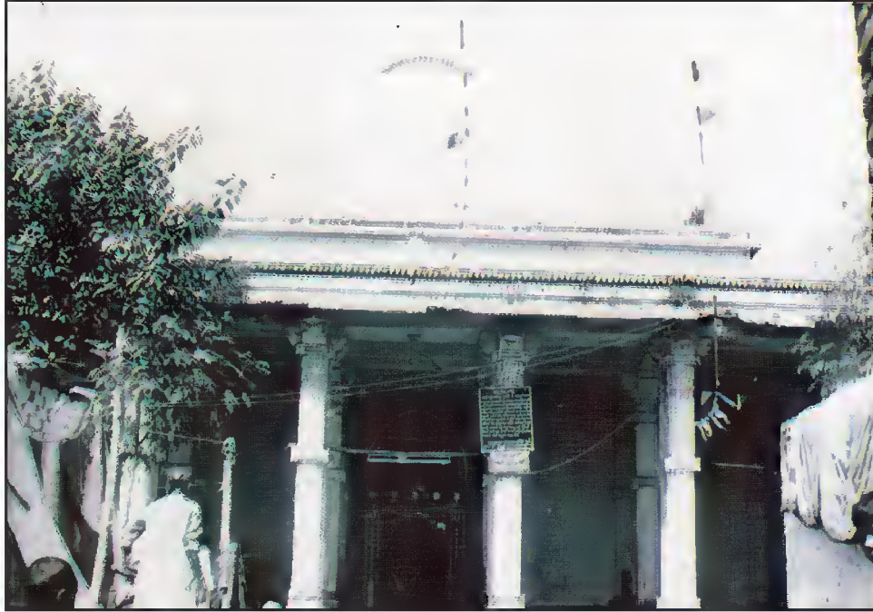
مقبرہ ملک شعبان صاحبؒ، باپونگر، احمد آباد