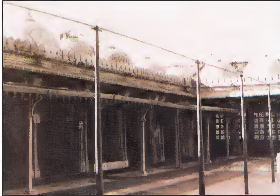
اندرونی منظر، پشاور والی مسجد، استویا، احمد آباد