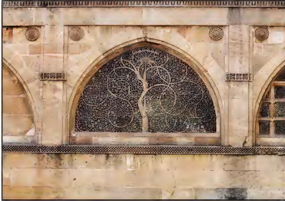
سیدی سعید کی مشہور جالی کی مسجد، لال دروازہ، احمد آباد