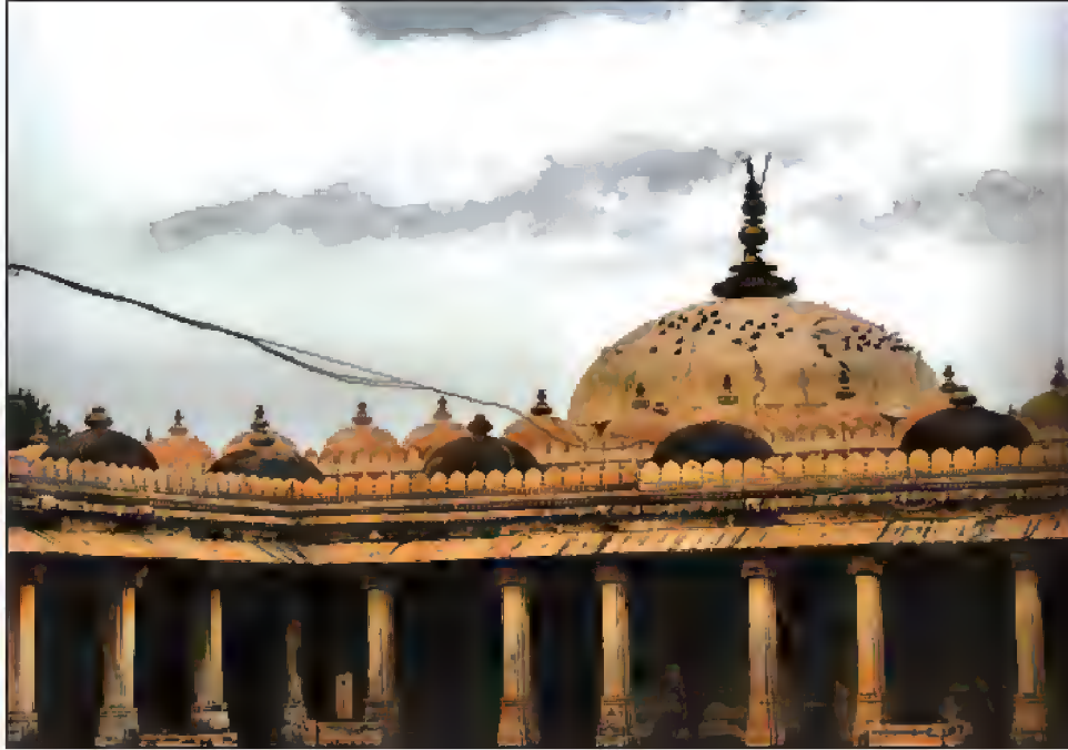
شاهی مسجد کاندرونی زوایه و کنده مزار حضرت شیخ سنج احمد (حضرت شیخ احمد کلنو)