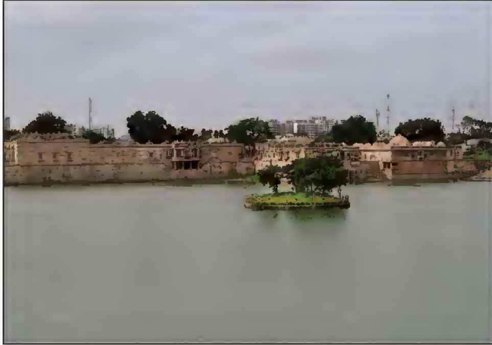
تالاب و شاعی گھاٹ، سرخیز احمد آباد