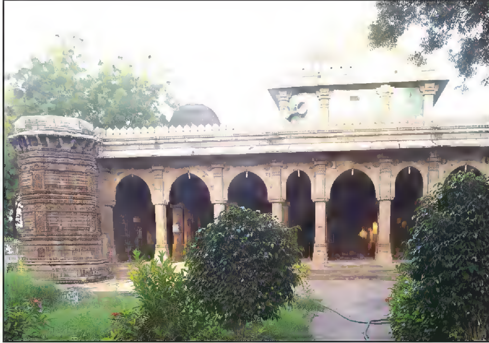
اندرونی منظر، مسجد حضرت ابو محمد بخاریؒ، عرف بابالولوی، منجوری، احمد آباد