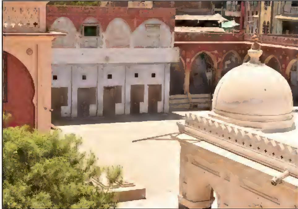
مزار حضرت شاہ بہرامؒ، پیر محمد روڈ، احمد آباد