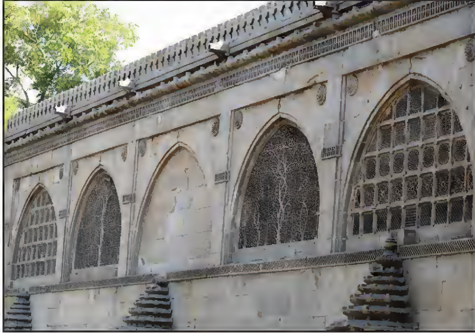
سیدی سعید کی مشہور جالی کی مسجد، لال دروازہ، احمد آباد