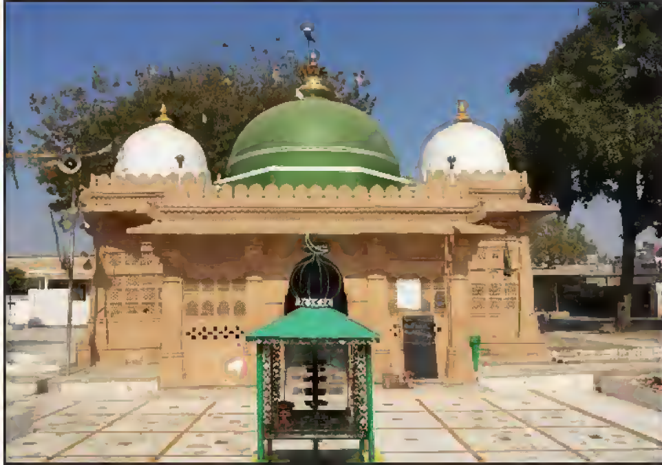
مزار حضرت امیر علی شاہ صاحبؓ، مرخیز، احمد آباد