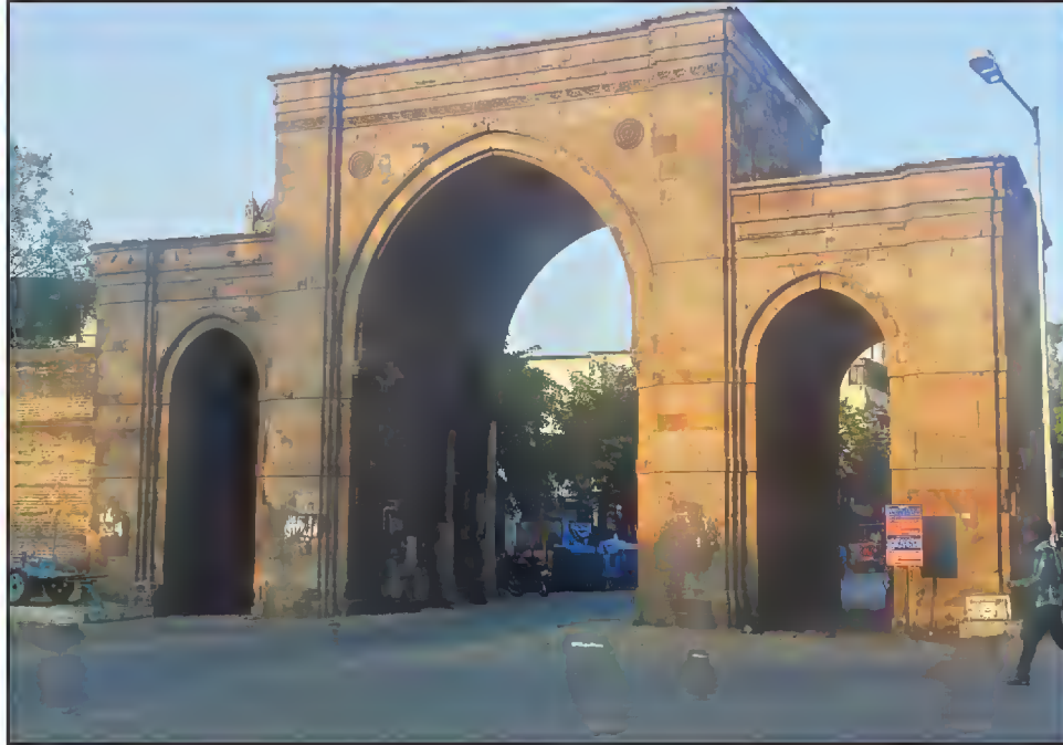
پانچ کنواں دروازہ، احمدآباد