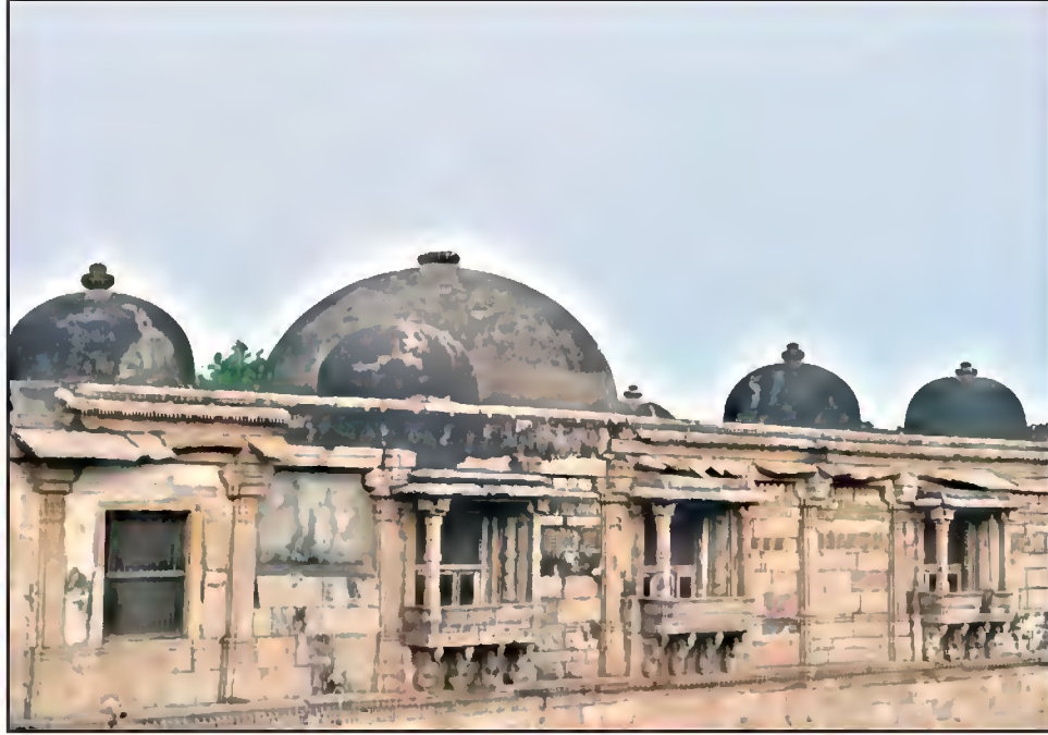
شاہی مسجد، ساہیوال کے دالان کا بیرونی منظر، سرخیز، احمد آباد