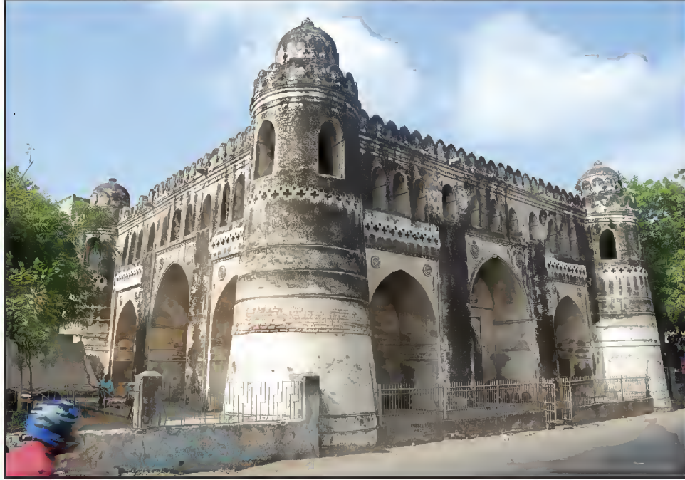
مقبره حضرت اعظم معظم صاحبان، سرخیز روڈ، احمد آباد