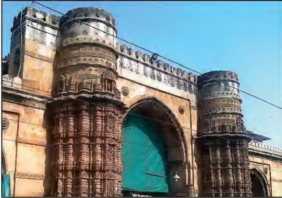
پشاور والی مسجد، دلی چنگل، احمد آباد