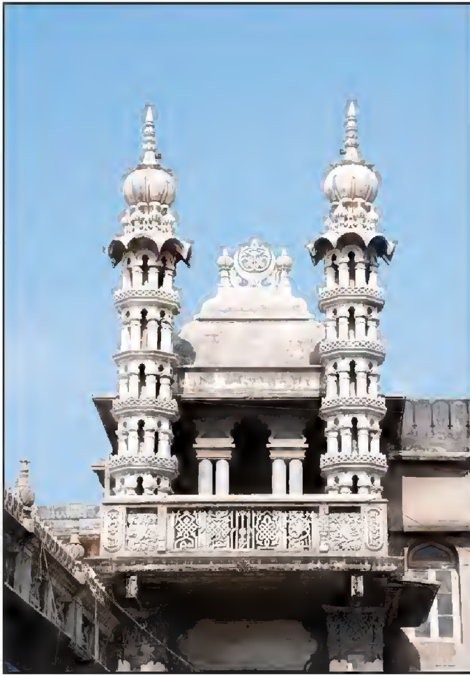
بیردنی منظر، مقبرہ حضرت شاہ پیر محمد، پیر محمد روڈ، احمد آباد