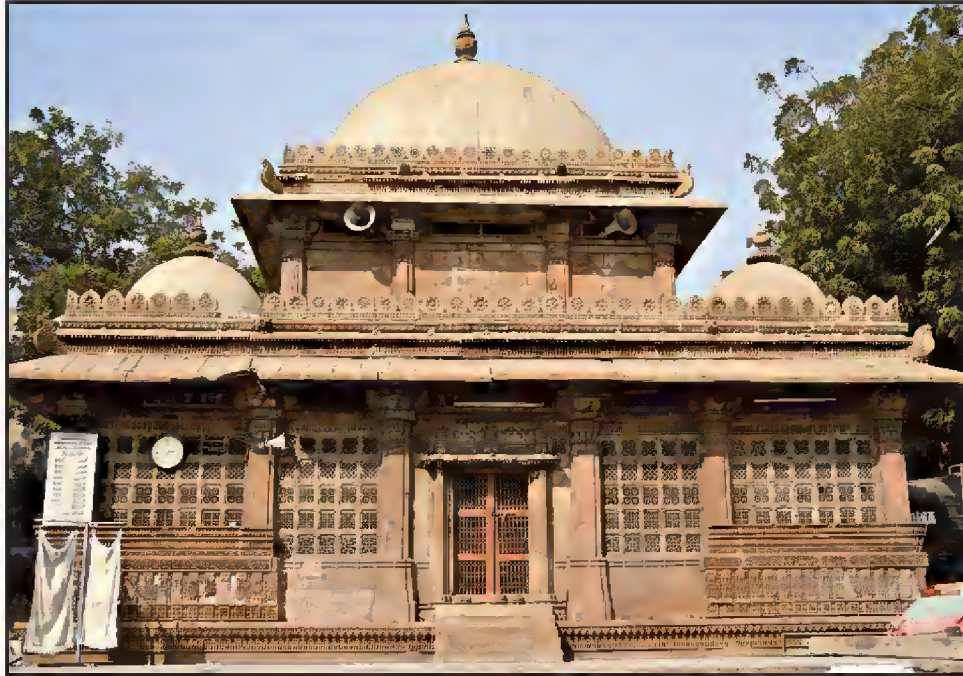
مقبره رانی سپری (صبری) استور یادروازه، احمدآباد