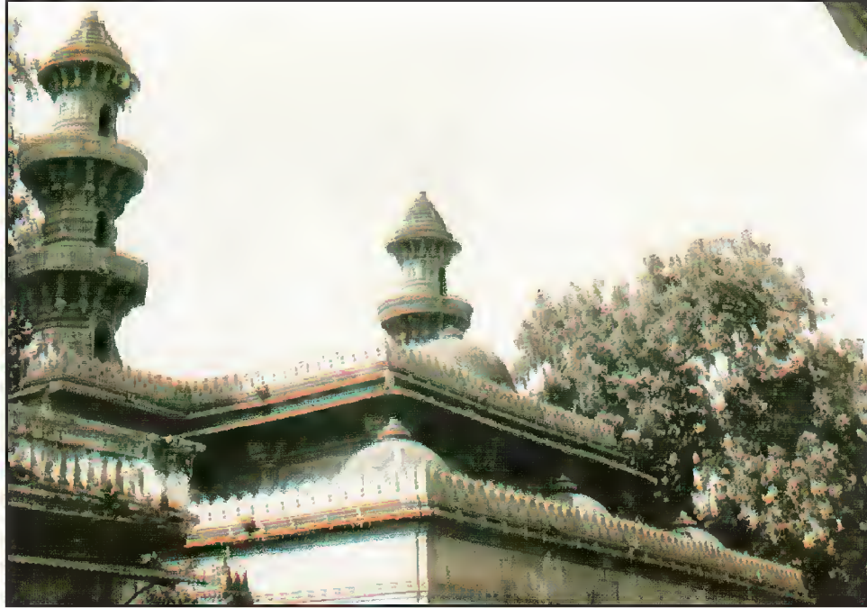
بیرونی منظر، مسجد محافظان، احمدآباد