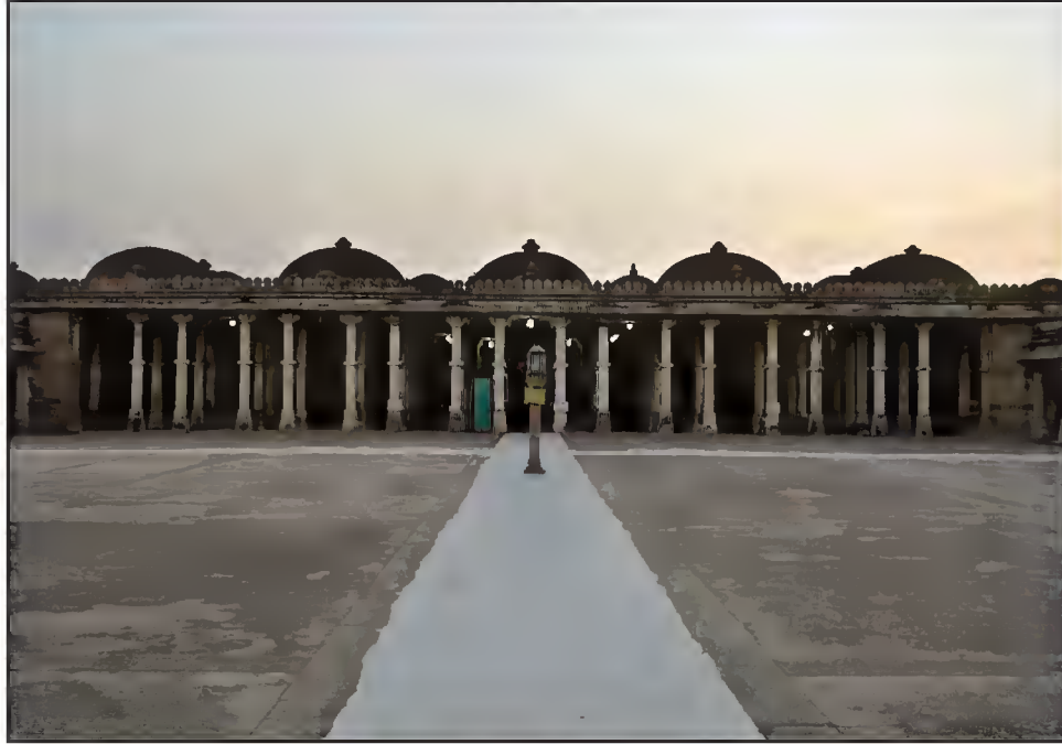
اندرونی منظر، شاہی مسجد۔ سرخیز، احمد آباد