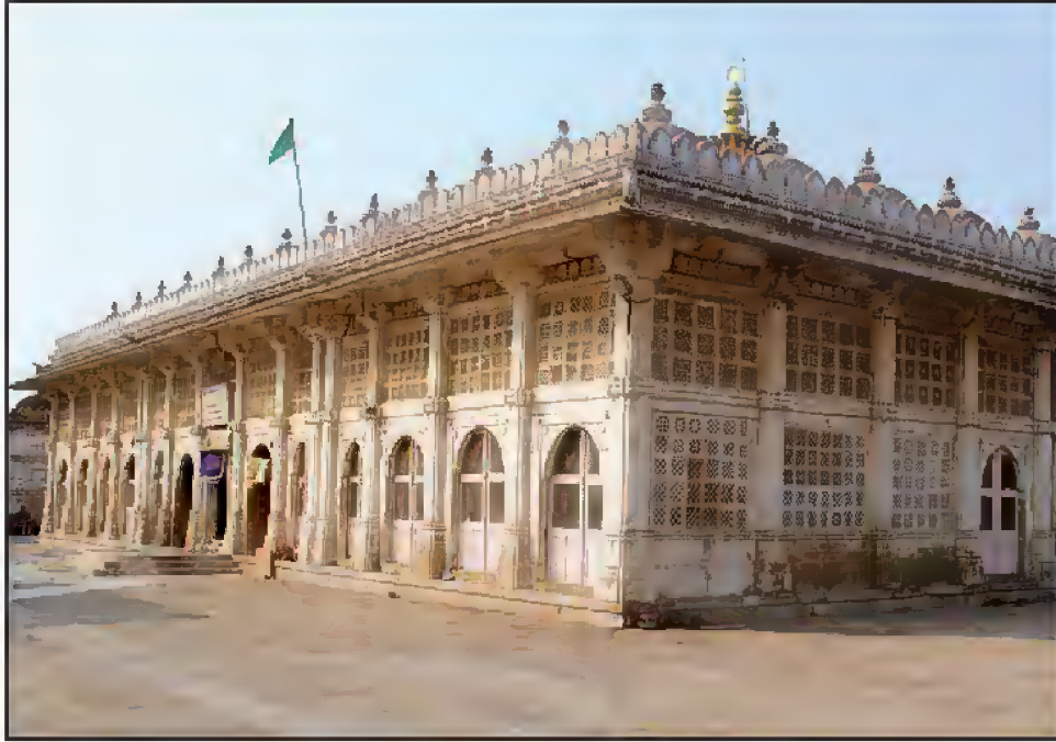
مقبرہ حضرت شیخ احمدؒ، عرف شیخ احمد کھٹو، سرفیز، احمد آباد