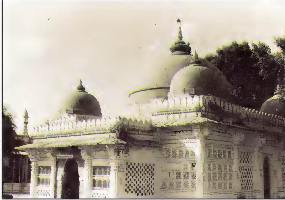
مقبرہ حضرت شیخ علی شاہ صاحبؒ، سرخیز، احمد آباد