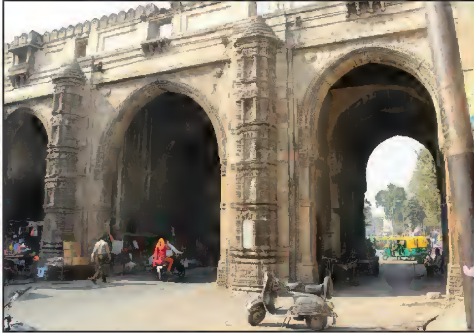
تین دروازہ، احمد آباد