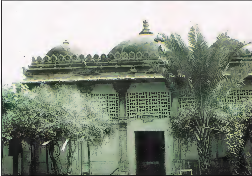
مقبرہ سیدی بشیر، سارنگ پور، احمد آباد