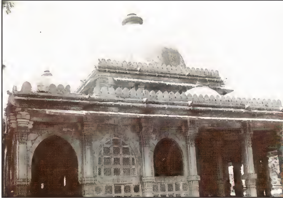
مقبرہ حضرت سلطان عالم، حضرت قطب عالم کے پوتے، دلو، احمد آباد