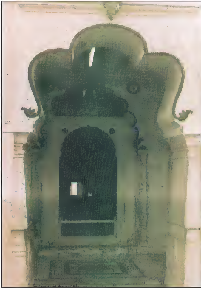
دروازہ مزار حضرت شاہ پیر محمدؒ، پیر محمدؒ روڈ، احمد آباد