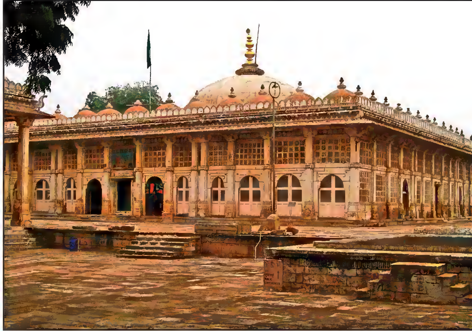
مقبرہ حضرت گنج احمدؒ، عرف شیخ احمد کھٹو، سرخیز، احمد آباد