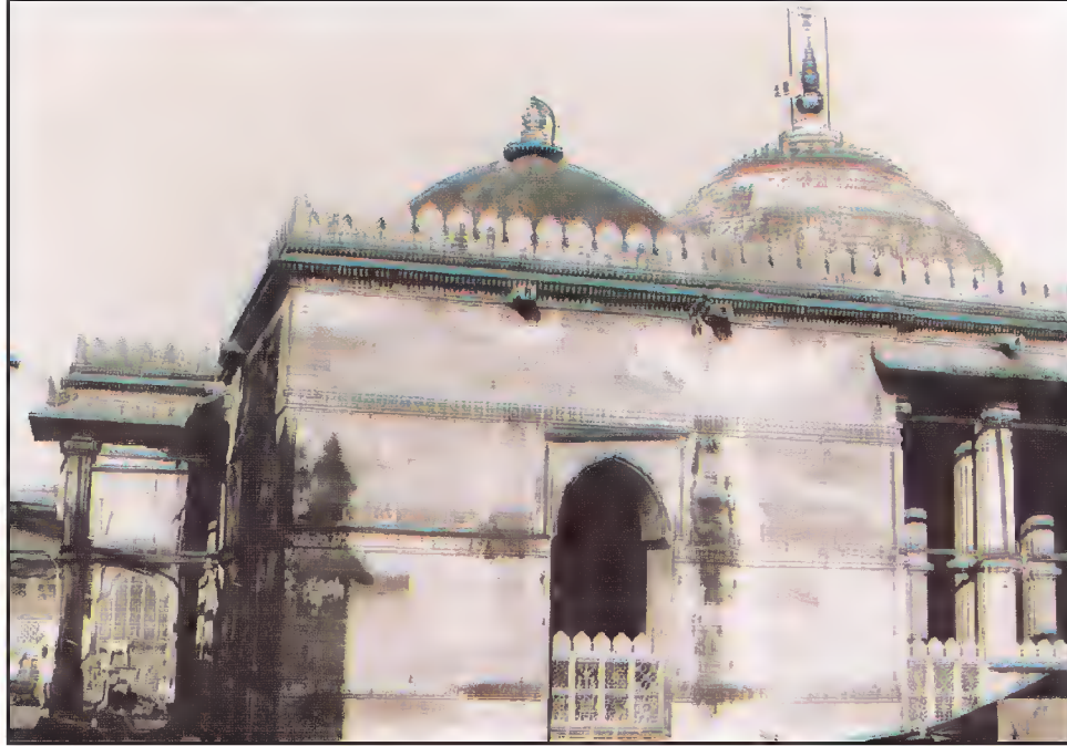
مقبره، سلطان احمد شاه اول، مانک چوک، احمد آباد