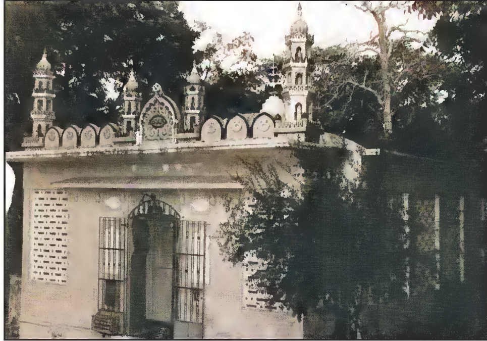
مزار حضرت موسیٰ سہاگ، دلی دروازہ، شاہی باغ، احمد آباد