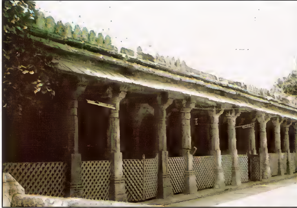
بیرونی منظر، مسجد حضرت قطب عالمؒ، ولوا، احمد آباد