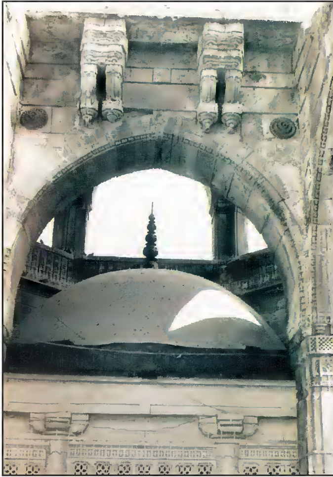
مقبره حضرت شاه قطب عالم، والد محترم حضرت شاه عالم، وٹوا، احمد آباد