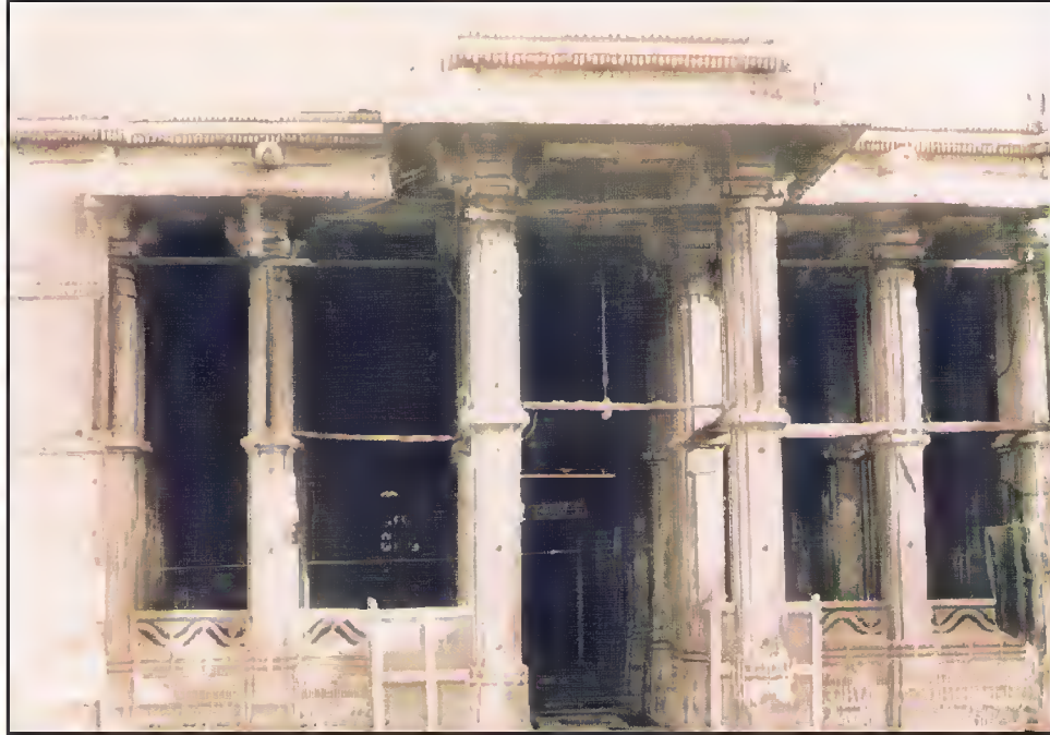
صدر دروازه، مقبره سلطان احمد شاه اول، مانک چوک، احمد آباد