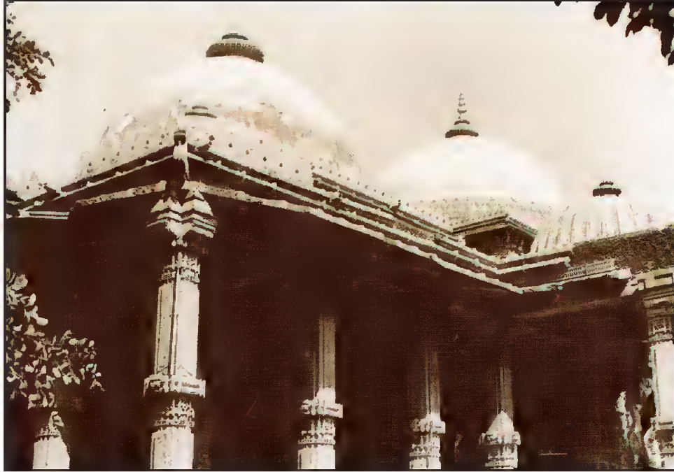
مقبرہ حضرت قدم رسولؐ، شاہ عالم روڈ، احمد آباد