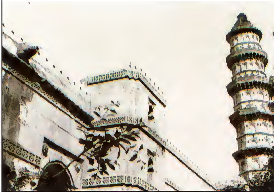
مسجد و مینار دولت خان، سارنگ پور، احمدآباد