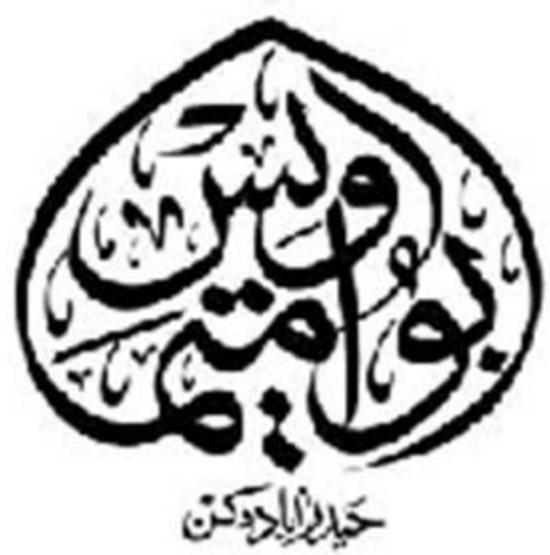
Abu Umamah Owais