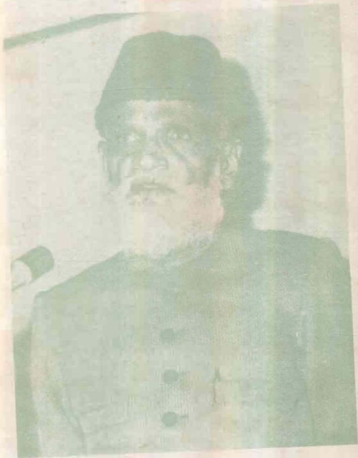
مولانا سید محمد رفیع قادری